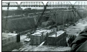
Travaux de remblayage de l'île Notre-Dame par les Entreprises Désourdy

Les photographies témoignent des travaux de remblayage mis en place par les Entreprises Désourdy et de la visite d'un laboratoire qui étudie l'impact de la création de l'île sur le fleuve Saint-Laurent.