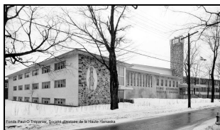
École secondaire pour fille Immaculée-Conception, en 1960. Architecte Paul-O. Trépanier.

(Cégep de Granby, Haute-Yamaska à partir de 1976, 235, rue Saint-Jacques)