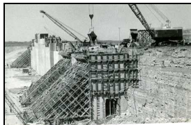
Travaux de remblayage de l'île Notre-Dame par les Entreprises Désourdy

« La solution Désourdy? Prendre le remblai dans le lit du fleuve que son ingénieur Comtois connaît bien pour avoir travaillé à la construction de la voie maritime du Saint-Laurent. On érige des batardeaux pour créer des enclaves temporaires pour retenir les eaux et extraire à l'intérieur autant de pierre dont on a besoin et la transporter sur une courte distance, sans déranger personne; l'un de ces batardeaux est érigé près du pont Victoria sur la rive droite du fleuve, et l'on crée l'île Notre-Dame, un autre est érigé près du pont Victoria sur la rive gauche et l'on complète la jetée McKay ; on fait la même chose près de l'île Ronde en aval de l'entrée de la voie maritime pour compléter la Ronde. » Cournoyer, Jean, La Mémoire du Québec en ligne , 2009, http://www.memoireduquebec.com/wiki/index .